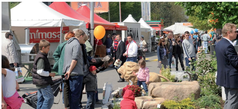
330 Aussteller laden zur 7. Bauen+Wohnen im Tägi Wettingen ein. Die Frühlingsmesse verzeichnet mit 6 Hallen ein erneutes Wachstum.