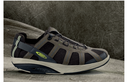
Modell Barafu für Herren in Olive

Innovativ in Stil und Funktion ist die Herrenkollektion. Sowohl das Casual- als auch das Athletic-Segment überzeugen mit leichten Materialien für maximale Atmungsaktivität, durch bequeme Futtermaterialien und raffinierter Konstruktion, ideal für Sport und Freizeit. Wer's eleganter wünscht, findet im Dress-Segment luxuriöses Leder und klassisches Styling mit absoluter Business-Tauglichkeit. Die perfekte Kombination von Life- und Healthstyle.