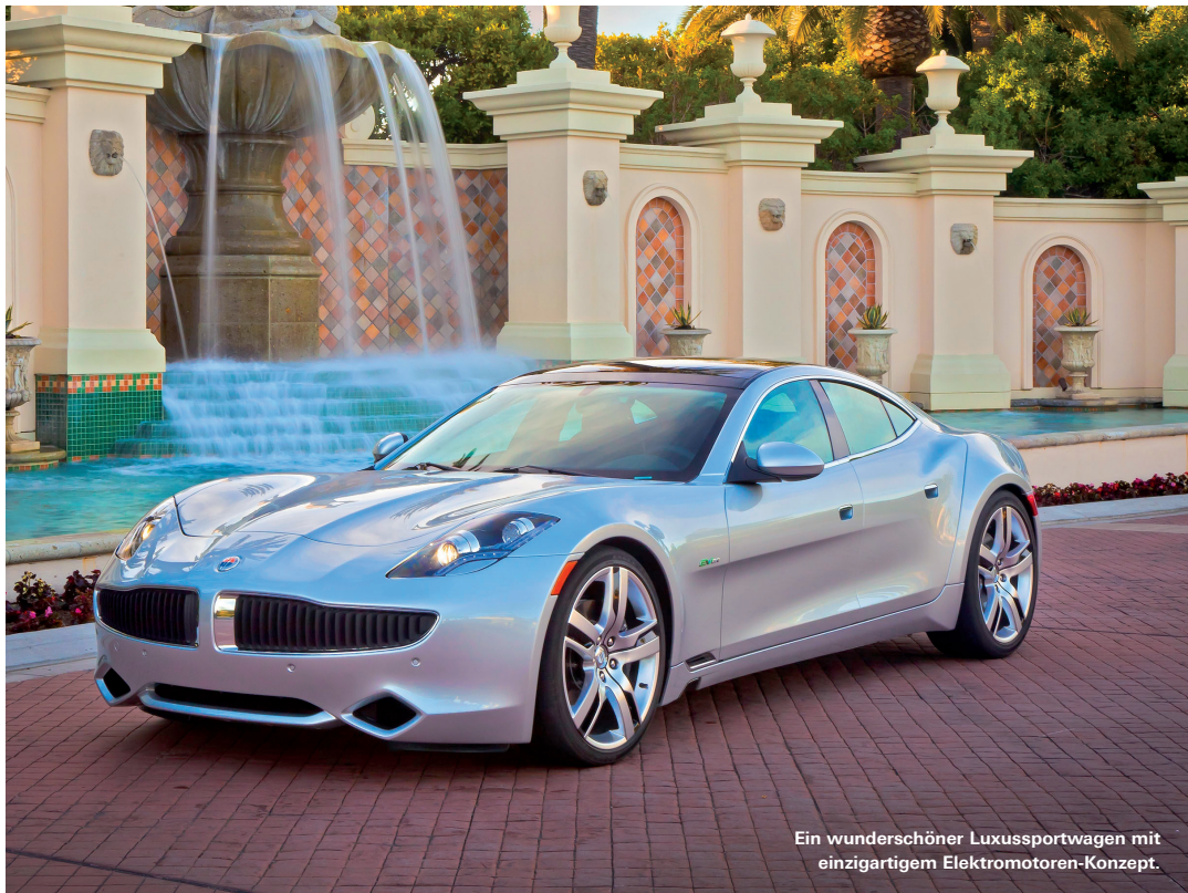
Ein wunderschöner Luxusportwagen mit einzigartigem Elektromotoren-Konzept.

9 Marken, grosszügige Ausstellungen und ein sehr motiviertes Team freuen sich auf Ihren Besuch an der Badenerstrasse 600 im Autohaus Zürich-Altstetten, am Hauptsitz der Emil Frey AG. ■