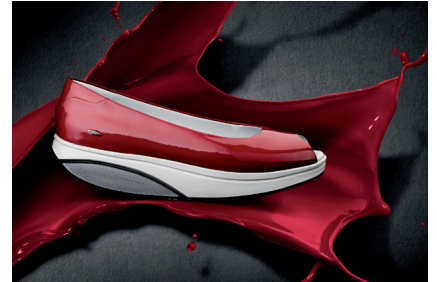
Modell Kianga für Damen in Crimson

Ob bequeme Freizeitschuhe oder bezaubernde Lackmodelle - die neuen Styles für den Sommer 2012 sind modische Statements mit voller MBT-Funktionalität. DER Hingucker sind die Lackmodelle, als knallrote Peep-Toes oder zierliche Sandaletten, beide auch in tief-schwarzem Lack erhältlich. Darf es dezenter sein? Die Casual Kollektion für Damen setzt besonderen Fokus auf moderne Interpretationen der Sommersandale, klassisch elegant und vor allem super-bequem, gemacht für leichtfüssige Städtebummler und Outdoor-Abenteurer.